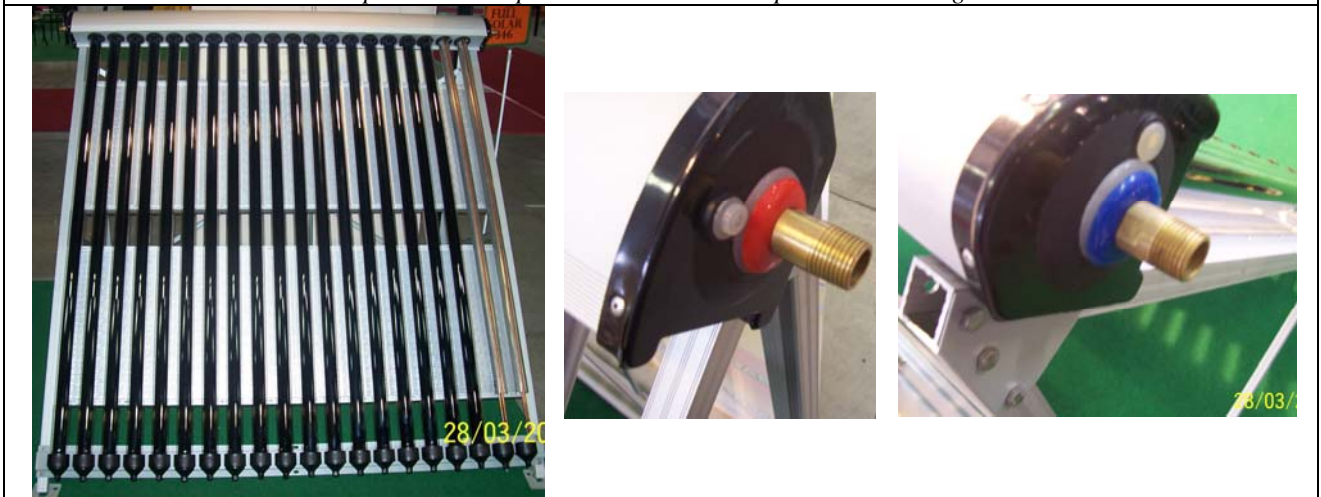
Il pannello a circolazione Naturale con tubi sottovuoto ed alcuni dettagli